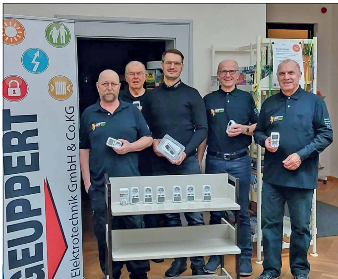
Reparaturcafé übergibt Stromverbrauchs-Messgeräte Bericht und Foto: Hildegund Fischer-Giebfried, Stadtbücherei Hofheim i.UFr.

Am 18.03.2023 laden wir alle zu „Der dicke fette Pfannkuchen“ ein.