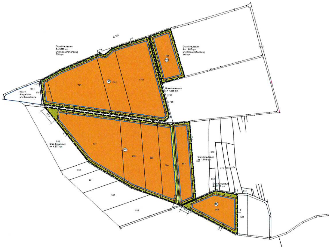
Abb. Geltungsbereich des Vorhabens (ohne Maßstab)

Ziel der Planung ist die Ausweisung eines Sondergebietes für eine Freiflächen-Photovoltaikanlage innerhalb eines nach dem Erneuerbare-Energien-Gesetz „landwirtschaftlich benachteiligten Gebietes“, um dem Bedarf an erneuerbaren Energien zu entsprechen.