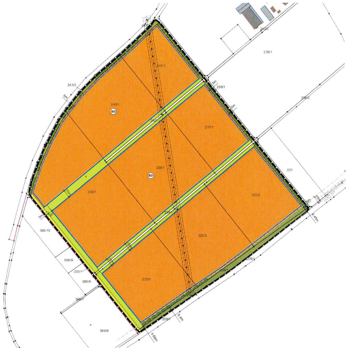
Abb. Übersicht Lage des Vorhabens ohne Maßstab

Ziel der Planung ist die Ausweisung eines Sondergebietes für eine Freiflächen-Photovoltaikanlage innerhalb eines nach dem Erneuerbare-Energien-Gesetzes „landwirtschaftlich benachteiligten Gebietes“, um dem Bedarf an erneuerbaren Energien zu entsprechen.