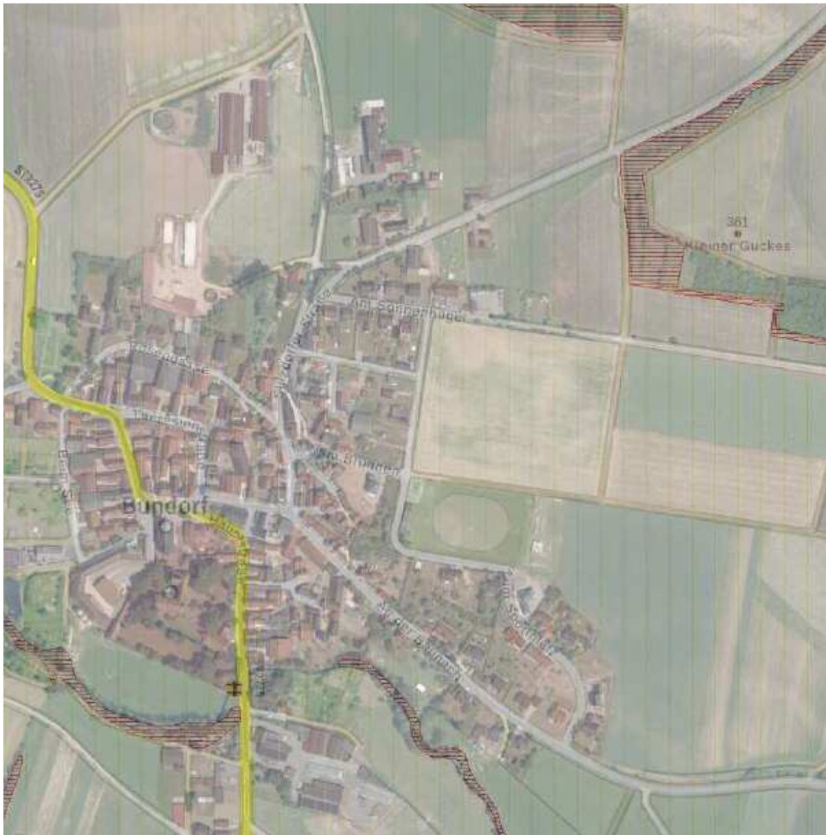
Auszug aus Bayern Atlas – Luftbild des Planungsgebiets

Das Plangebiet liegt im Naturpark Haßberge auf einer landwirtschaftlichen Fläche.